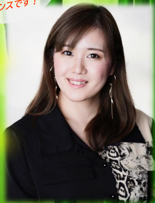
紫咲大佳(元宝塚歌劇団)