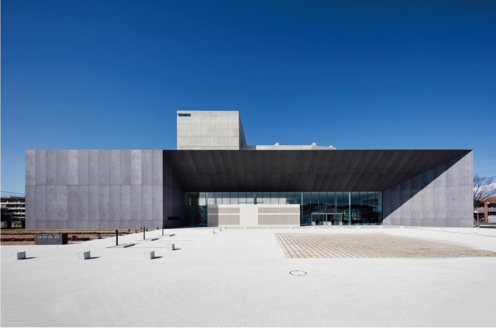
太田市民会館 Ota Civic Hall